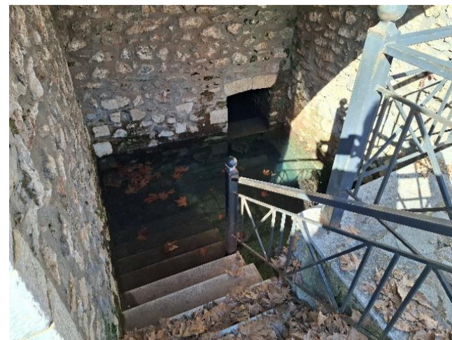
Επιτέλους αρκετό νερό στην πηγή της Παναγίας!