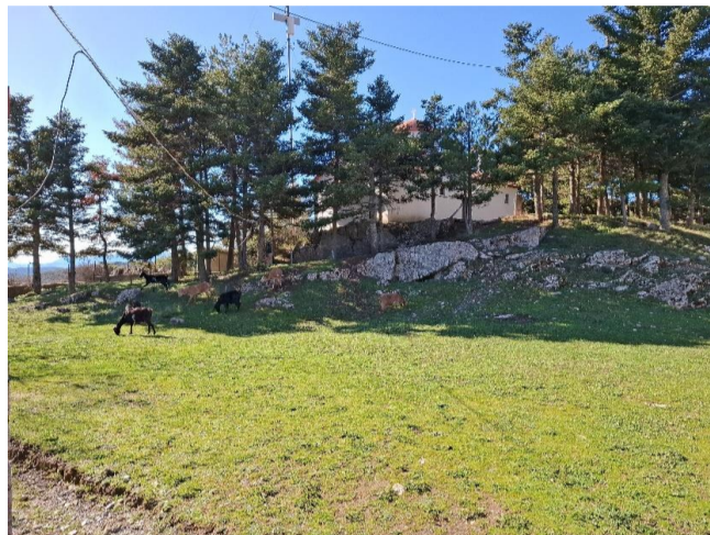
Καταπράσινο τοπίο στον Ιερό Ναό Αγίου Ιωάννη στο Ρολόι Ευκαιρία για τα κατσικάκια!