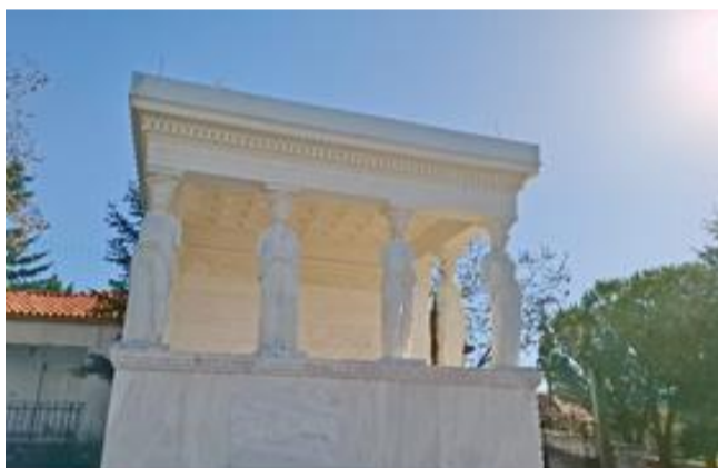
Το μνημείο των Καρυατίδων λάμπει στην χειμωνιάτικη λιακάδα!